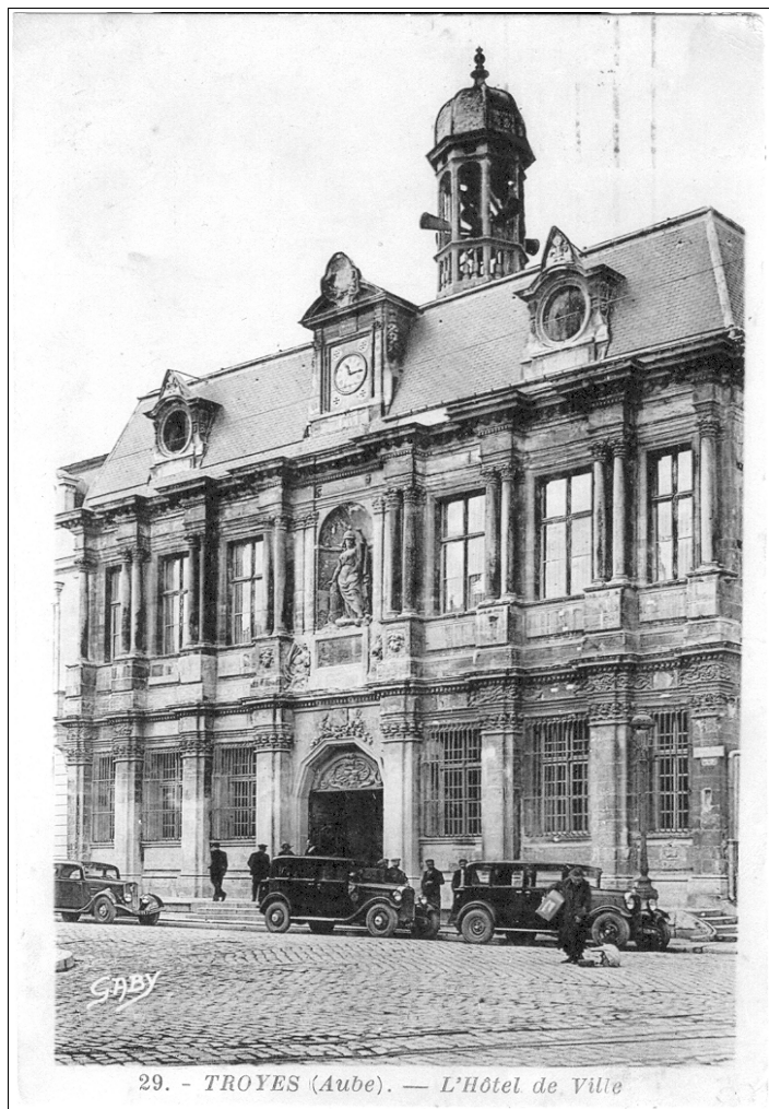
29. - TROYES (Aube). — L'Hôtel de Ville

Le 15 juin à 13 heures, j'étais prisonnier !